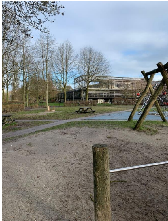
Figuur 1: Vrijgekomen stuk grond in de speeltuin

De speeltuin, zoals die er nu uitziet, is een mooie traditionele tuin met speeltoestellen en zitgelegenheid. Op het terrein is ruimte vrijgekomen nadat de noodlokalen zijn verwijderd. Het betreft een aanzienlijk stuk grond. Niet alleen is er fysiek ruimte vrijgekomen, er is binnen de speeltuin en wijk ook ruimte voor ontwikkeling en verbetering. Daarom heeft het Stichtingsbestuur de wensen en behoeften van de diverse verenigingen en de bewoners geïnventariseerd om te zien wat op het moment nog aan de speeltuin ontbreekt. Daarbij is gekeken naar de samenstelling van de wijk en te verwachten demografische ontwikkelingen. Duidelijk is geworden dat behoefte is aan een uitbreiding binnen de bestaande speeltuin. Met de uitbreiding wordt, naast de al aanwezige traditionele speeltoestellen, zoals schommels, klimrek en een speelhuisje, een nieuwe speelwaarde aan de speeltuin toegevoegd: de waarde van het natuurlijk spelen.