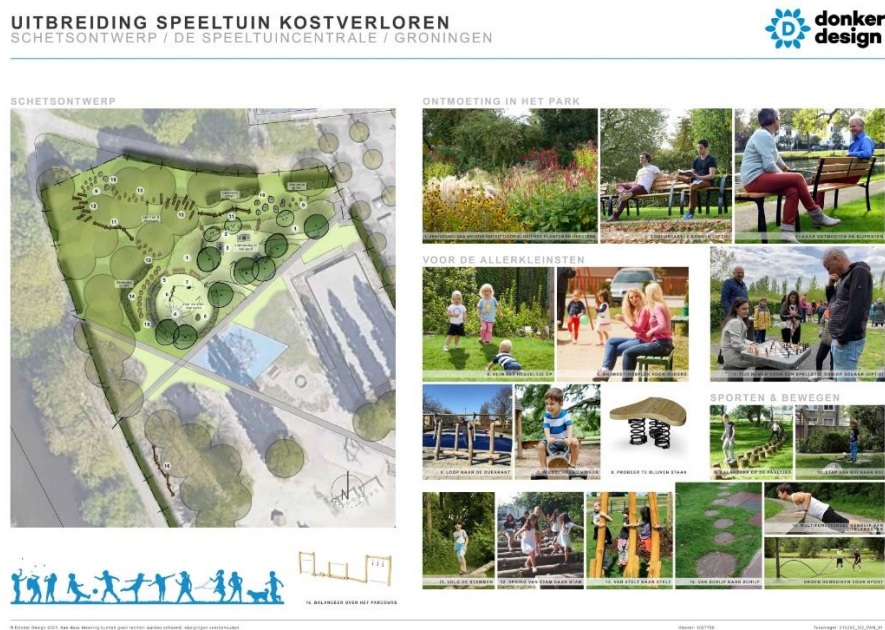
Figuur 2: Schetsontwerp uitbreiding in samenwerking met Donker Design en De Speeltuincentrale